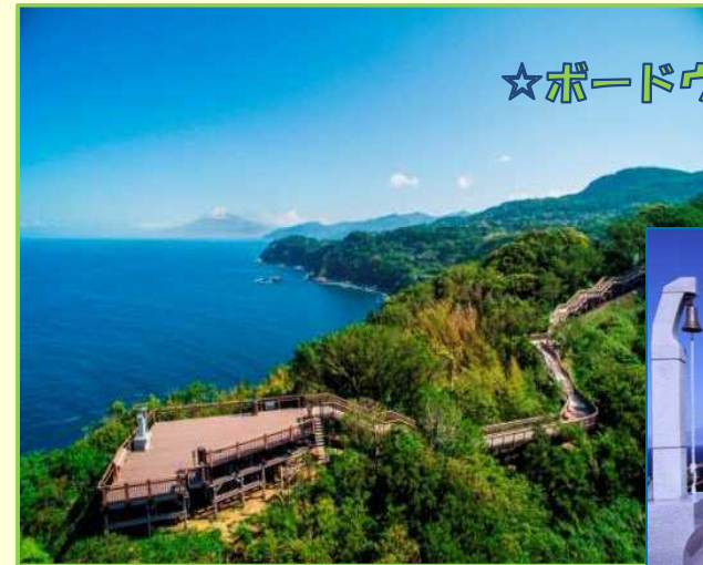
☆ボードウォーク全景

当該施設は、多くの観光客が訪れる観光地であり、伊豆半島を代表する名所に位置付けられている。しかしながら、既設のボードウォークは気象条件や施設利用によって摩耗していたことから、観光客の安全を確保するため、全面改修を行ったもの。